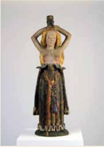
Heilige Agathe, Tonplastik