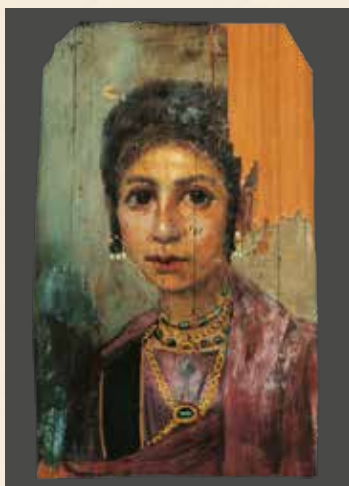
Mumienporträt einer jungen Frau. Wachs auf Holz (Enkaustik-Technik), 96–117 n. Chr