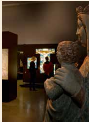
Trier im Mittelalter