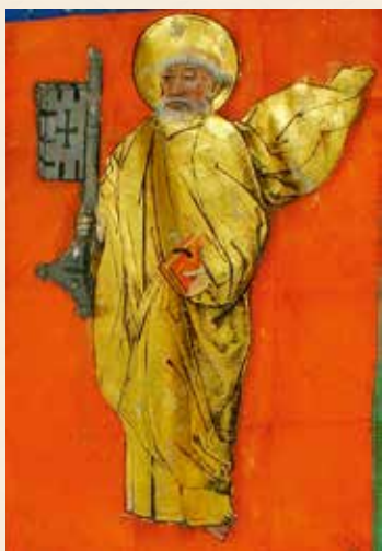
Heiliger Petrus